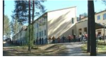
Laukaan koulu ja lukio.

Noin 20 km Jyväskylästä pohjoiseen sijaitseva Laukaa ja Sydän-Laukaan koulu ja lukio sekä niiden yhteydessä oleva ilmava liikuntahalli muodostavat ensi kesän valtakunnallisen Kristus-juhlan pitopaikan. Koulu ja liikuntahalli ovat lähellä Laukaan keskustaa, os. Saralinnantie 3. Tilaisuudet pidetään liikuntahallissa ja ruokailut sen yhteydessä olevassa koulun ruokailusalissa. Kaikki saman katon alla.